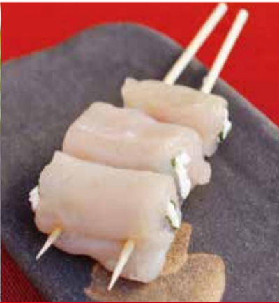
ささみしそチーズ